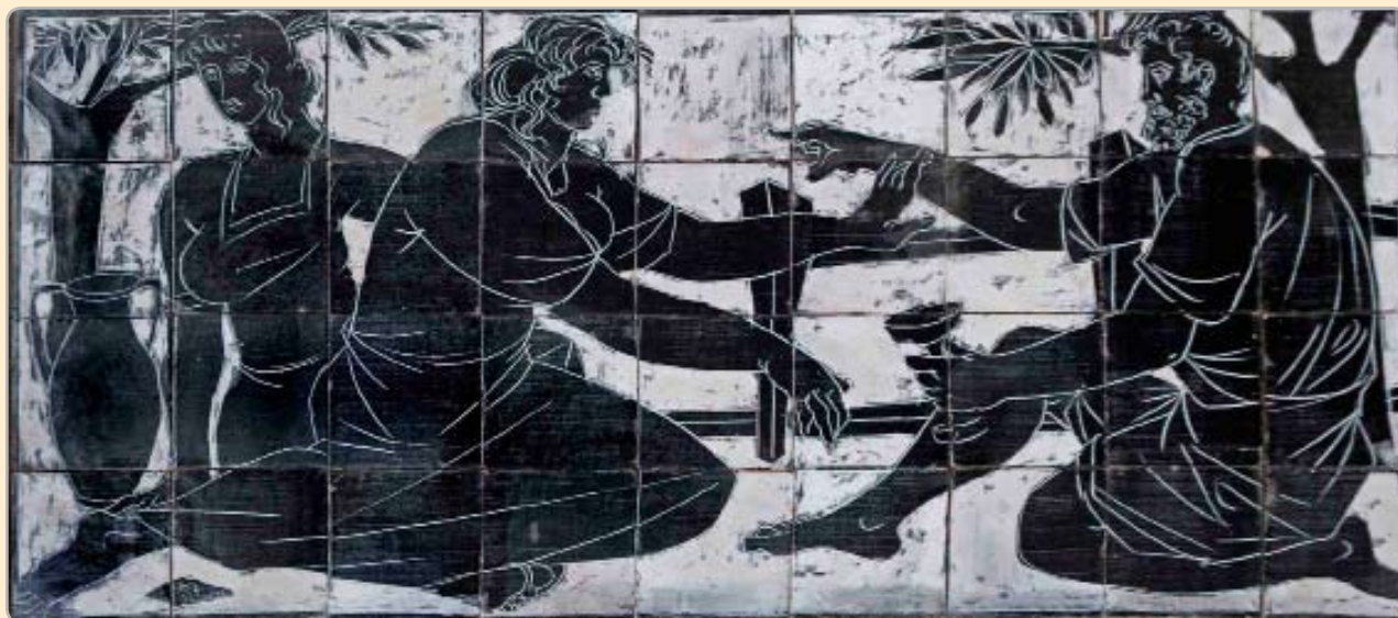
Amerigo Tot Égetett egyedi kerámia, (195 x 80 cm), 1952