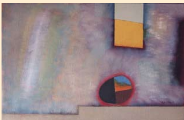
Nyári fények, olaj vászon, 35x40 cm (1977)

lehet, mint a figurális nyelvezetű. E kiállítás ismételten példát mutat arra, hogy az egyes alkotói hagyatékokban számos olyan alkotás lelhető fel, amelyek nem csupán jó újra látni – hát még milyen nagyszerű élmény először látni –, de hasznos újfent mérlegre helyezni, mit is ér. A képelemek valóban absztraktnak tűnnek, ám élménytartalmuk nagyon is konkrét. Az érzéken felkiáltó sárgák, viaskodó vörösek, tisztázó szellemi kékek gyűrűjében táruul fel Gerzson Pál magyar tája: nem csupán a Balaton partján fekvő Szigliget képe, hanem a tájjal azonosított, abba fonott sors is. A kiállítás 2010. április 5-ig tekinthető meg.